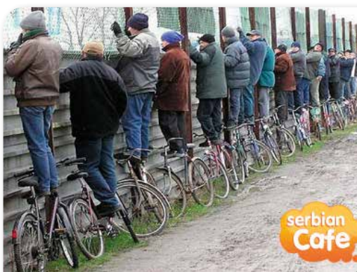
„НС бајк“, може и тако