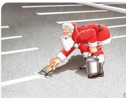
И ирваси паркирају, зар не!