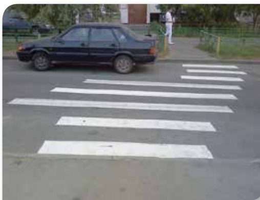
Пешачки прелаз на паркингу!