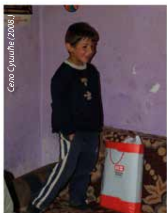
Село Сушиће (2008.)